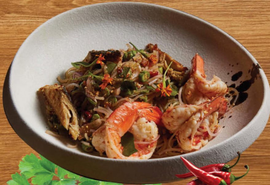
ยำขนมจีนกึ่งกับปลาหู 480 Northeastern style fermented rice noodle salad with prawns and mackerel fish