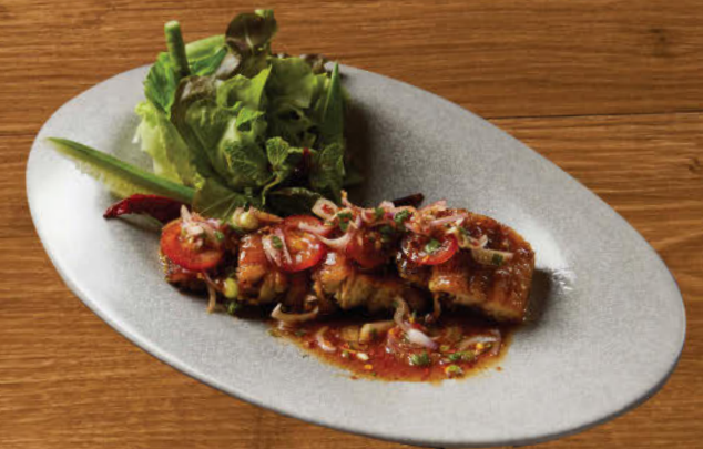
ปลาดุกย่างน้ำตก 480 Grilled catfish topped with Thai spicy sauce, roasted rice powder, spices and marinated cucumber