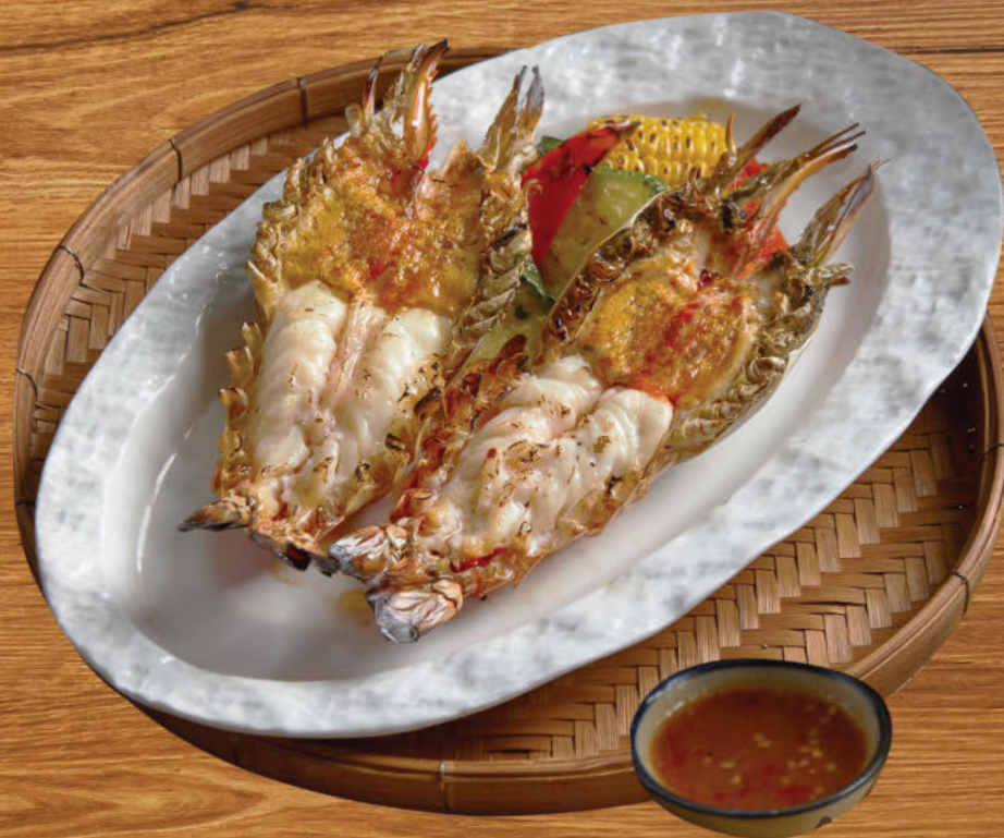
กุ้งแม่น้ำ 1,500 River prawn