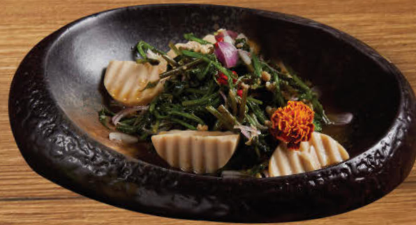
ยำผักกูดสองหมู 380 Southern vegetable salad with Vietnamese pork sausage and minced pork