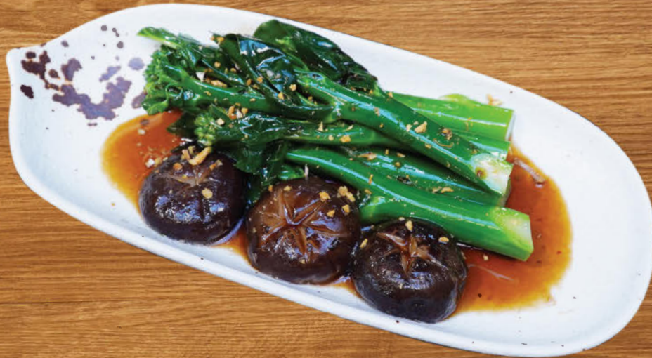
ก้านฮ่องกงซอสเห็ดหอม 300 Wok-fried Chinese kale and Shiitake mushroom with mushroom sauce