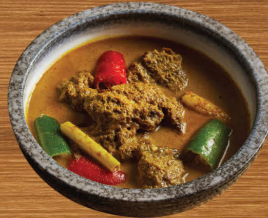
แกงระแวงเนื้อ 680 Beef cheek turmeric curry with lemongrass