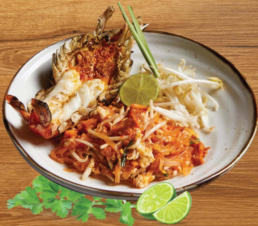
ผัดไทยกุ้งแม่น้ำ 780 Stir fried rice noodle with river prawn, tofu, egg, beansprout and tamarind sauce