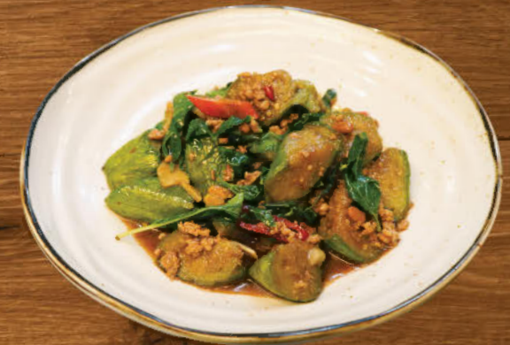
ผัดมะเขือยาวใบโหระพาหมูสับ 350 Stir-fried eggplant with minced pork, chili and sweet basil

Prices are subject to a 7% VAT and a 10% service charge.