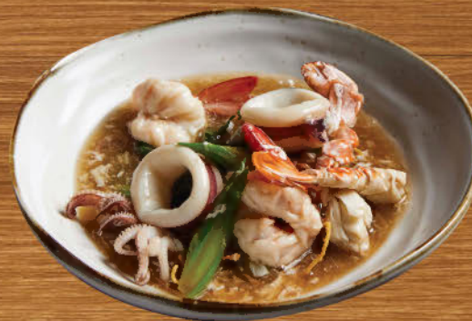
ราดหน้า ธารา นาวา 590 Deep fried egg noodle in mix seafood gravy sauce