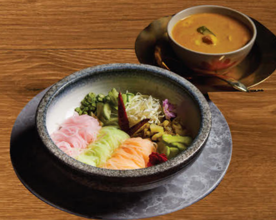
ขนมจีนน้ำยาปู 780 Crab meat curry with fermented rice noodle