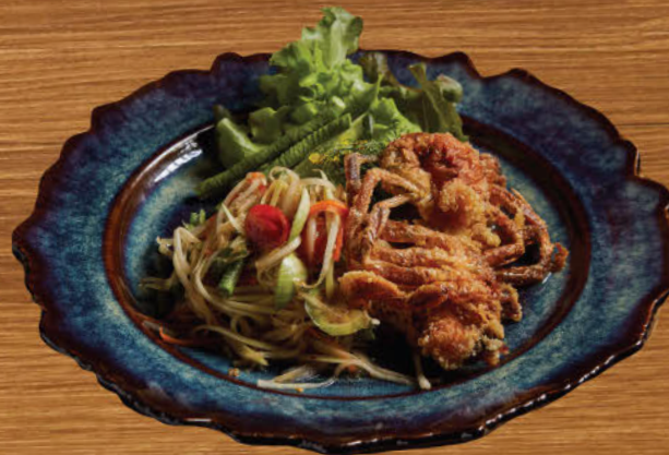
ส้มตำปลาร้าปูนิ่ม 680 Famous Thai papaya salad with crispy fried soft-shell crab and "Pla Rah" Thai fermented fish