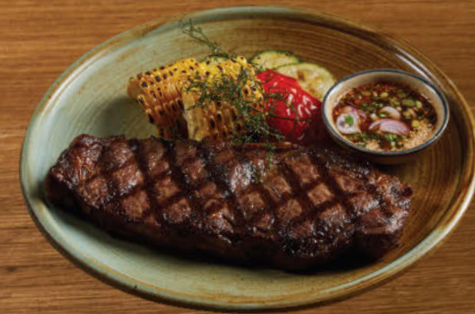
เนื้อวัวออสเตรเลีย 2,300 Australian beef striploin (300 g.)