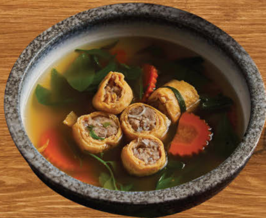
แกงจืดยอดผักหวาน ไข่ม้วนหมูทรงเครื่อง 480 Clear soup with wild Thai forest vegetables and egg roll with marinated minced pork