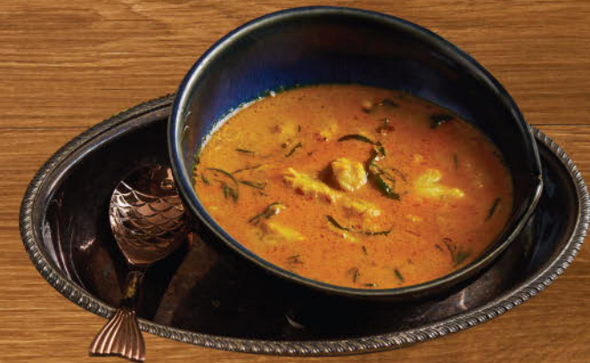
แกงคั่วปูใบชะคราม 890 Crab meat and seabite leaves curry "Southern style"