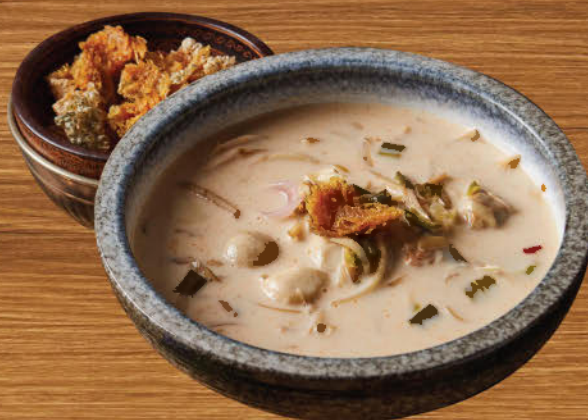
ต้มข่าหัวปลีปลาสดทอด 480 Banana blossom and deep fried gourami in galangal coconut milk soup