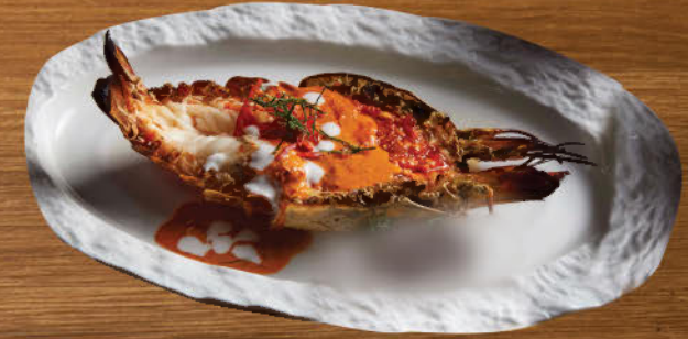
กุ้งย่างแม่น้ำ 950 Grilled river prawn with red curry sauce