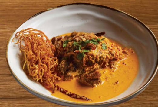
ข้าวซอยเนื้อแก้มวัว/ไก่ 370 Northern style coconut yellow curry with egg noodles, braised beef cheek or chicken thigh and topped with crispy noodle