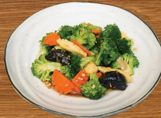
ผัดผักสามสหาย 280 Stir-fried broccoli, baby corn and carrots with soy sauce and oyster sauce