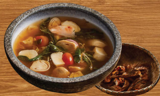
ต้มโคล้งปลากรอบ 480 Spicy and sour smoked dried fish soup