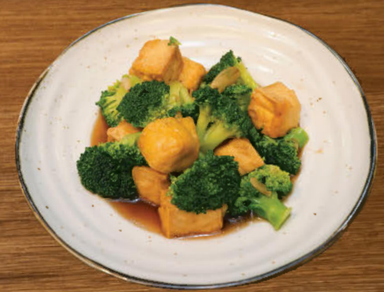
ผัดบล็อกโคลี่ 280 Stir-fried broccoli and custard tofu Klong Ngae with soy sauce and oyster sauce