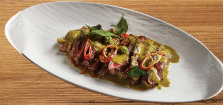
แกงเขียวหวานเนื้อวากิว 690 Grilled Wagyu beef green curry