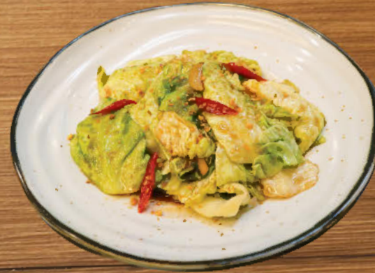
ผัดผักกะหล่ำหัวใจ 280 Stir-fried pointed cabbage with chili, garlic, soy sauce and oyster sauce