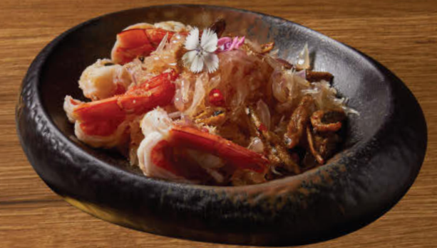
ยำส้มโอ 580 Spiced pomelo and prawns salad topped with dried Southern crispy fish