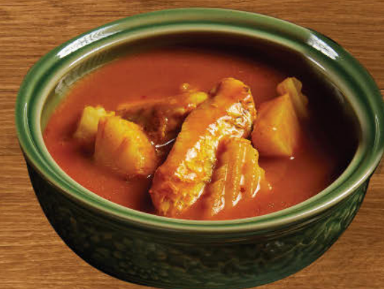
แกงเหลืองปลากะพง 420 Southern Thai spicy and sour yellow curry with seabass and coconut tips