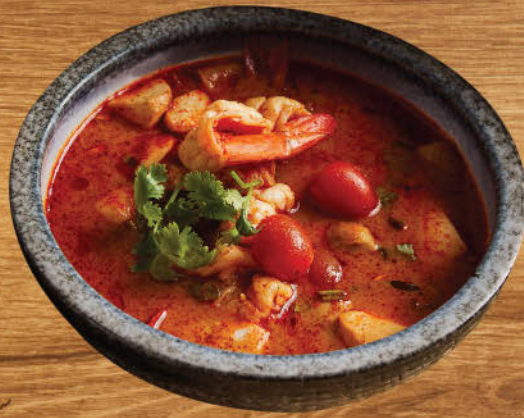
ต้มยำกุ้งมะพร้าวอ่อน 580 "Tom yum" famous Thai spicy prawn soup with young coconut