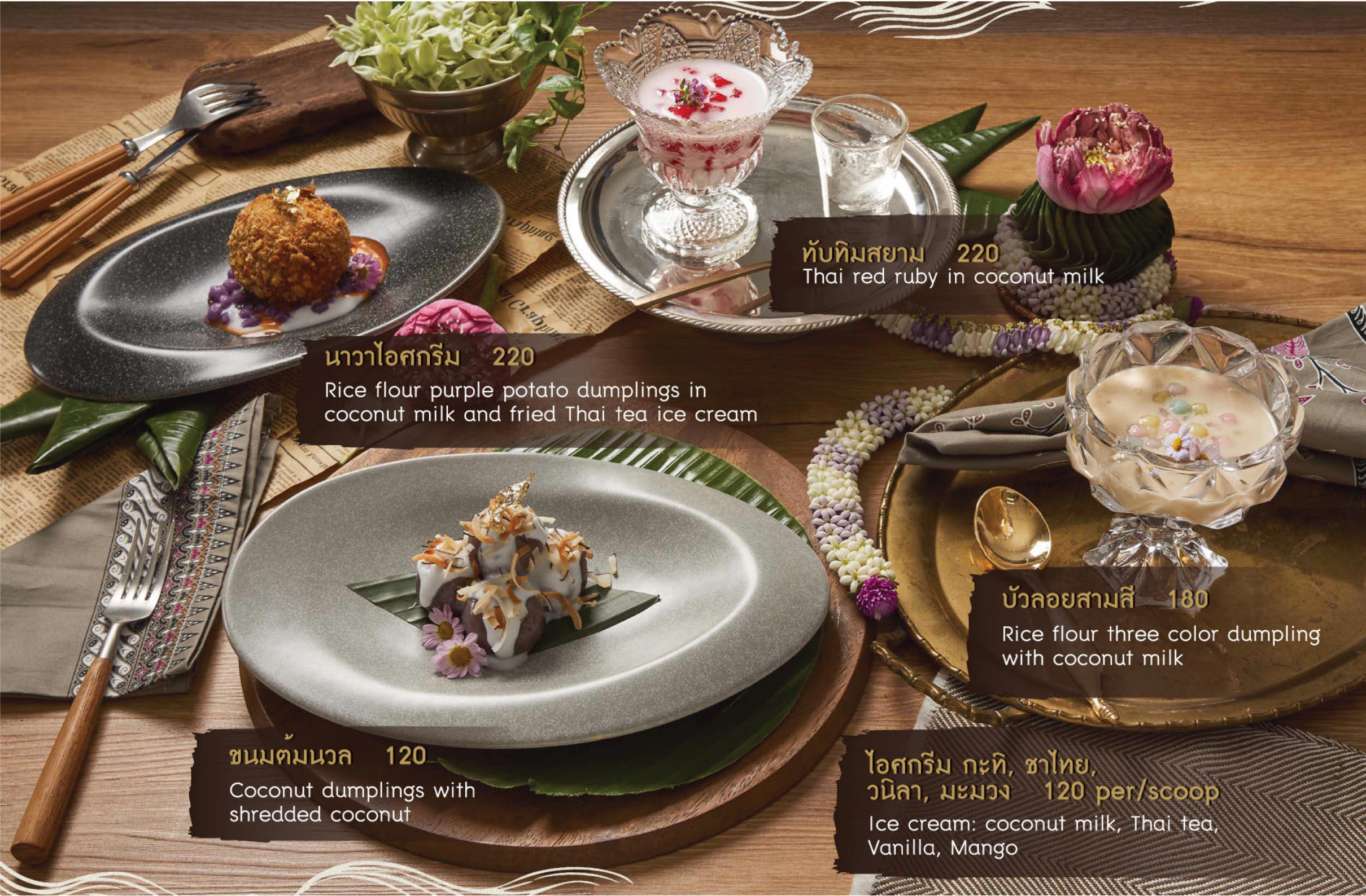
ทับทิมสยาม 220 Thai red ruby in coconut milk