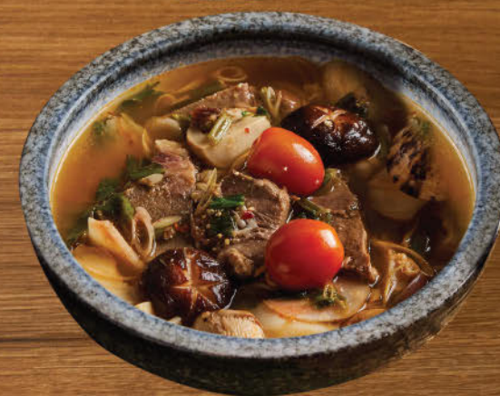
ต้มแซ่บสตูลิ้นวัว 680 Spicy and sour ox tongue soup "Northern style"