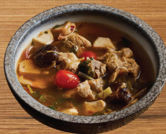
ต้มแซ่บกระดูกอ่อน 480 Esan style spicy hot and sour pork ribs soup