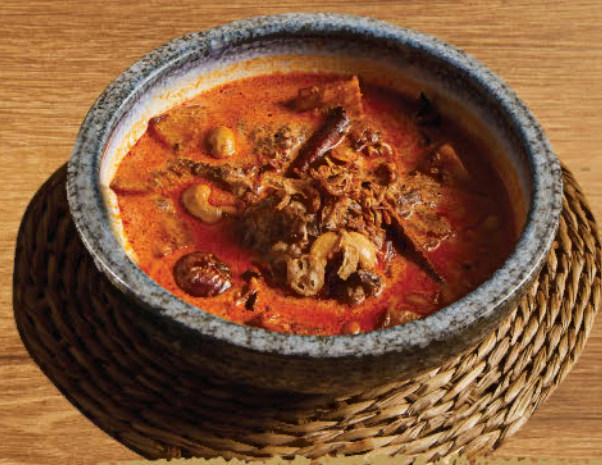
มัสมั่นเนื้อแก้มวัว 680 Beef cheek "Massaman" curry